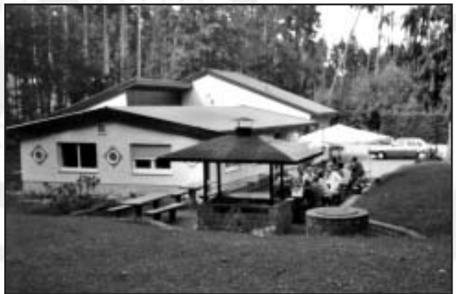
Blick auf die sanierte Vereinsgaststätte.

Die in Eigenarbeit erstellten, mittlerweile jedoch zu beengten Sportstätten, konnten in den Jahren 1988/90 dank großzügiger finanzieller Förderung durch die Stadt Trossingen und den Württ. Landessportbund mit einem nahezu kompletten Neubau des Schießstandgebäudes mit 12 Pistolenständen und einer Luftgewehrhalle mit 15 Ständen ersetzt werden, wiederum in Eigenleistung.