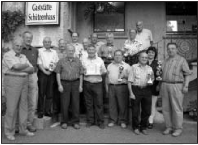
Unser Bild zeigt die Senioren-Schützen nach der Siegerehrung am Schützenhaus in Denkingen.