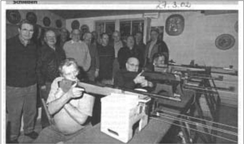
Ragen Zuspruch findet die Senioren-Freundschaftsrunde des Schützenkreises Tuttlingen. Unser Bild stammt vom Auftaktchießen in Bärenthal.

Schützengilde Denkingen ging. Mittlerweile ist die zweite Runde im Gange, der letzte Wettkampf findet Ende Juni statt. Eine weitere Runde ist bereits angedacht, entsprechende neue Anreize im Ablauf sind in Planung.