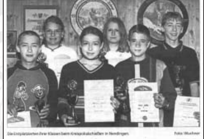
Die 1. und 2. Platzierten ihrer Klassen beim Pokalschießen in Nendingen.

Den Bogenschützen der SGI Denkingen gelang im Jahr 2001 der absolute Höhepunkt des Schützenjahres, Tobias Gaßner und Dominik Ciossek wurden Deutsche Meister .