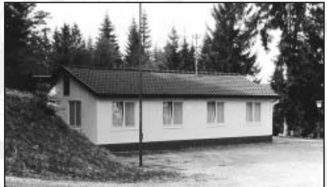
Das Schützenhaus im Jubiläumsjahr 1983 (oben) Armbrustdemonstrationsschießen im Rahmen der KK-Schießstandeinweihung am 1.9.2002 (unten)