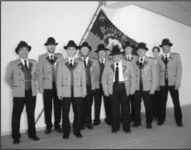
Vorstandschaft Schützenverein Dürbheim (oben) Jugend Schützenverein Dürbheim (unten)