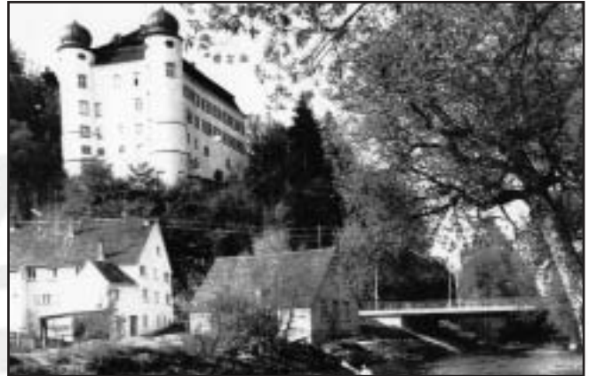
Übungsraum im sogenannten Schaffstall an der Donau unterhalb des Schlosses von 1961 - 1965