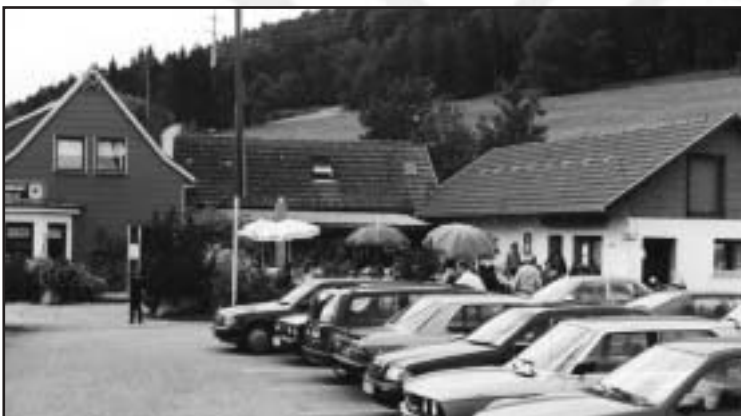
Frontansicht des Schützenhauses der SG auf dem Schönblick. Hinter und unter dem Gebäude befinden sich die Schießanlagen.