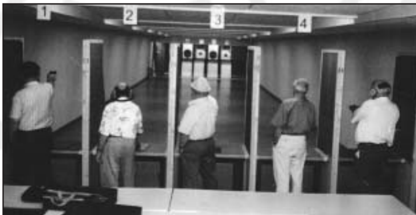
In geschlossener Bauweise schalldicht und voll belüftet bietet die neue Pistolenhalle der SG fünf Schießstände für alle Kurzaffen-Disziplinen