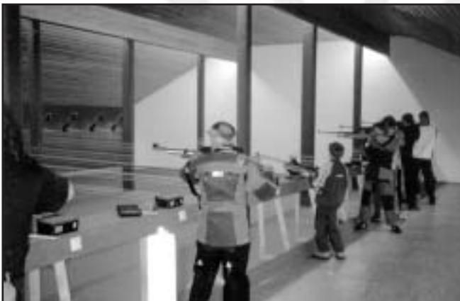
Blick in die LG-Halle

Das 1997/98 generalsanierte Vereinsheim, das in eigener Regie bewirtschaftet wird, bietet Platz für 80 Personen und ermöglicht vielfältige gesellige Veranstaltungen.