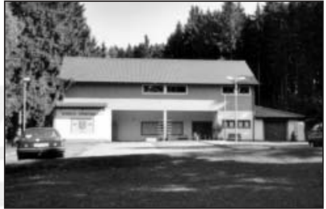
Blick auf das Schießstandgebäude

Jeweils am 1. Mai und im September veranstalten die Schützen Laienschießen für die Öffentlichkeit, die im Trossinger Veranstaltungskalender eine feste Größe darstellen und von Jung und Alt gerne besucht werden.