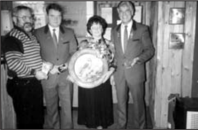
Schützenkönig mit Rittern