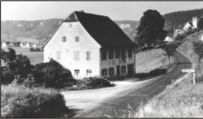
Übungsraum im ehemaligen Gasthaus "Zum Schützen" in der Gartenwirtschaft 1960-1961 mit 3 Luftgewehrständen