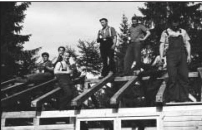
Richtspruch Schützenhaus 1965