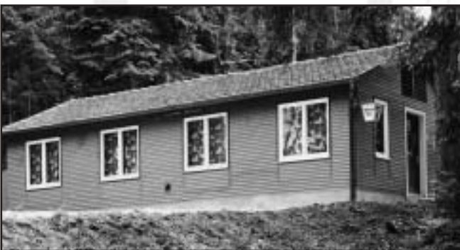
Das Schützenhaus bei der Einweihung 1968 (oben) Einweihungsfeierlichkeiten am 1.9.2002 zur Inbetriebnahme der neuen KK-Kugelfanganlage (unten)